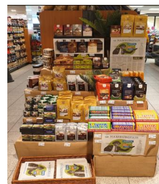
Umsetzungsbeispiel: Edeka Niemerszeil, 2021