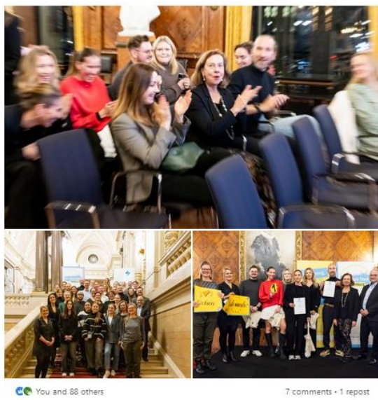
LinkedIn Post ISM Hochschule, 2023