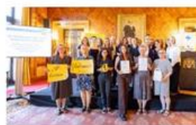
Fotorakt im Rathaus: Das Siegerteam der Leuphana Uni Lüneburg stellte sein Marketing- und Kommunikationskonzept für den Weltladen Lübeck vor.

Hamburger Wirtschaft (print) Hamburger Wirtschaft (digital) Nord Wirtschaft Fairtrade Deutschland